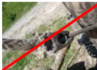
Choker d'élingue droit dans la boucle d'épissure : à éviter (usure prématurée)