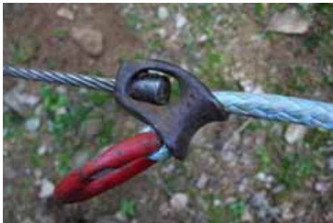
Chokers d'élingue coudés, sur anneau : adapté à toutes situations

Le nœud en terminaison provoque une rupture fréquente avec des gros bois : l'épissure est indispensable.