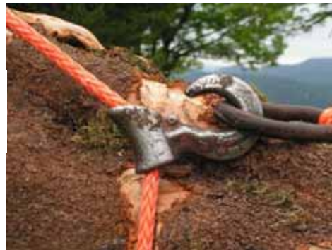
Crochet coulissant : simple et opérationnel