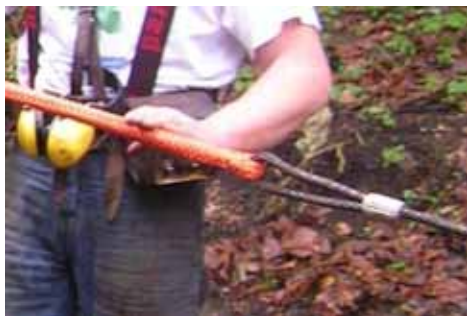
Elingue métallique associée au câble synthétique : préservé des frottements sur le câble synthétique.