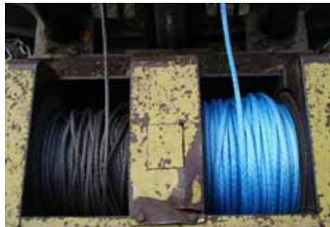
Enroulement parfait sur le treuil