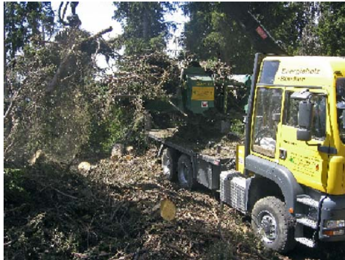
Equipement de fagotage monté sur un camion

sont déchiquetés. La mise en fagots des branches permet de réaliser le déchiquetage en dehors de la forêt sur une place de travail. Les gains de productivité au déchiquetage sont alors très importants (x 3 d'après une entreprise suisse). Certaines installations consomment aussi directement les fagots sans broyage préalable. Ce conditionnement permet un transport optimisé des branches et cimes, avec du matériel de transport courant (celui qui transporte les billons).