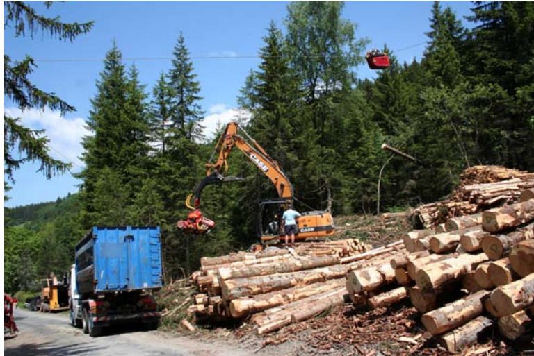
Chargement des branches dans des bennes

Dans le cas du déchiquetage d'arbres entiers (scénario 0 non testé), les coûts de bûcheronnage (abattage manuel) et de débardage sont imputables à la production de plaquettes bois-énergie et s'ajoutent aux coûts du/des transports (des arbres entiers ou ébranchés jusqu'à une plateforme de conditionnement de la plaquette). Dans ces conditions, les coûts de récolte sont incompatibles avec les prix de marché de la plaquette forestière. Pour un déchiquetage des arbres entiers, une aide financière des collectivités est donc nécessaire. L'évaluation des coûts techniques est résumée sur les graphiques suivants. Dans tous les cas, la plaquette est livrée ou fabriquée (scénario avec mise en fagots) sur le site de consommation.