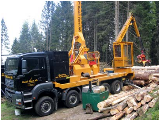
Perspectives : façonnage du bois d'œuvre en billons (ici en Suisse)

Le billonnage des arbres sur la piste juste après le débardage est pratiqué dans les autres pays de l'arc alpin, avec des équipements rassemblés sur la plateforme d'un camion ( photo ci-contre ). Les billons peuvent être stockés « en travers de la piste » derrière le camion porte-outil. Le stockage et la manutention des bois sont facilités ; la logistique